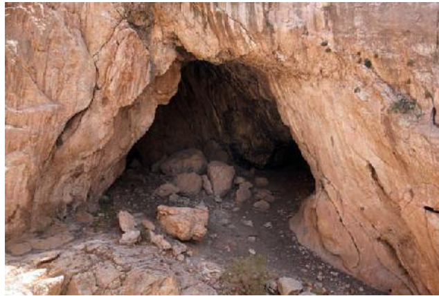
غار میرداوود - ارومیه:

قلعه میرداوود در حدود ۲۰۰ متری ضلع شمالی روستای میرداوود و مشرف به آن واقع شده است. روستای میرداوود یکی از روستاهای دهستان برادوست از توابع بخش صومای برادوست شهرستان ارومیه بوده و رودخانه نالوچای در جنوب آن جریان دارد. این روستا در موقعیت درّه ای واقع شده، کوه سیاه در شمال شرقی، کوه زردی در جنوب غرب و کوه زندان در جنوب شرقی آن واقع شده است. درّه میرداوود در جهت شمالغرب روستا و درّه آسینگران در جهت جنوب غربی آن قرار گرفته است. [۳] قلعه که در طول جغرافیایی ۴۶۵ ۴۹ ۴۴ و عرض جغرافیایی ۳۴۸ ۴۰ ۳۷ واقع شده و ارتفاع آن از سطح آبهای آزاد ۱۵۰۹ متر است، مشرف به رودخانه نالو، درّه و روستای میرداوود بوده و مساحت تقریبی آن ۴۰۰ در ۳۰۰ متر است و به لحاظ قرارگیری قلعه در مجاورت روستای میرداوود به این نام اشتهار یافته است. اما در برخی کتب تاریخی و قدیمی مرتبط با تاریخ منطقه همچون شرفنامه، تالیف امیر شرف خان بدلیسی نام قلعه داوود چند بار تکرار شده است. در فصل چهارم این کتاب در ذکر حکام برادوست نام قلعه داوود به کار رفته ولی اشاره دقیق و روشنی به این قلعه و موقعیت جغرافیایی و ویژگی های معماری آن نشده است. ضلع جنوبی قلعه پرتگاه مرتفعی قرار گرفته است. راه دسترسی به قلعه از ضلع غربی میسر بوده است. در ضلع شمالی قلعه دامنه های صخره ای کوهستان قرار گرفته و خود قلعه به روی سطحی نسبتاً صاف احداث شده است.