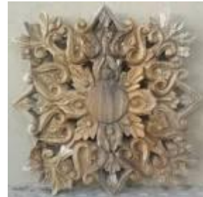
مُنَبَّت چوب :

نقشه: شطرنجی و نقشه کشکولی یا محراب در زمینه جاجیم و بعضی با نقش ساده برای پشت لحاف و نقشه کشکولی برای نگهداری لحاف استفاده می شود. دریافت برمال (جانماز) همین طرح ها بطور سفید و سیاه می باشد. ۲۶